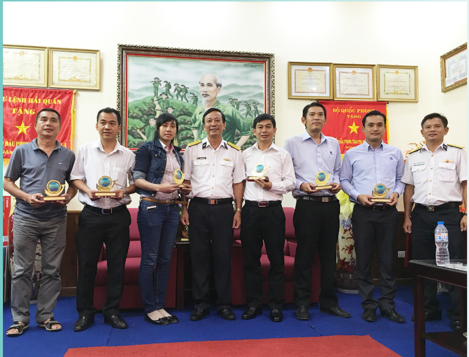
Bộ môn Chăn nuôi, Khoa Nông nghiệp và Sinh học Ứng dụng

T hực hiện kế hoạch thường niên của Bộ Tư lệnh Vùng 5 Hải quân, ngành Chăn nuôi Trường Đại học Cần Thơ phối hợp với Chi hội Chăn nuôi Cần Thơ và một số công ty cùng đoàn cán bộ của Bộ Tư lệnh đã tư vấn kỹ thuật chăn nuôi, thăm hỏi và tặng quà cho các đơn vị đóng quân trên vùng biển, đảo Tây Nam của tổ quốc (Thổ Chu, Hòn Khoai, Hòn Chuối, Nam Du và Hòn Đốc).