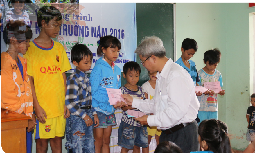
Các em nhỏ được tặng đồng phục cho năm học mới.

2016 đã nhận được sự ủng hộ, đóng góp nhiệt tình từ các đơn vị trực thuộc Trường Đại học Cần Thơ; công đoàn các phòng, ban, trung tâm; quý thầy, cô; các tổ chức, công ty và các mạnh thường quân. Vào ngày 08/7/2016, đoàn