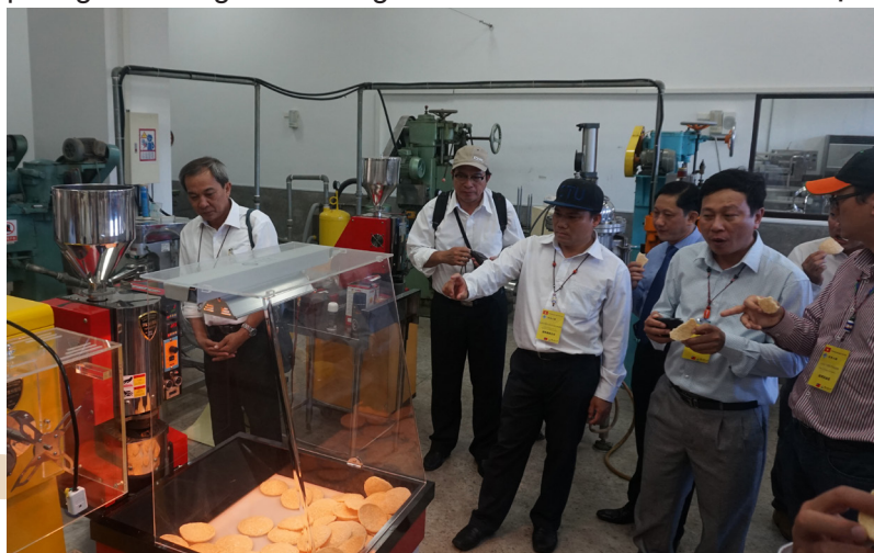
Tham quan nhà máy chế biến thực phẩm tại Trường Đại học Hàng hải Cao Hùng.

tích cực giúp tăng cường hơn nữa vị thế của Trường với các đối tác trong khu vực. Từ những cuộc tiếp xúc, trao đổi giữa Trường ĐHCT với các trường đối tác đã góp phần tăng cường sự hiểu biết lẫn nhau, làm nền tảng để xây dựng mối quan hệ đối tác tốt đẹp và bền vững, mở ra nhiều cơ hội hợp tác triển vọng trong các mảng