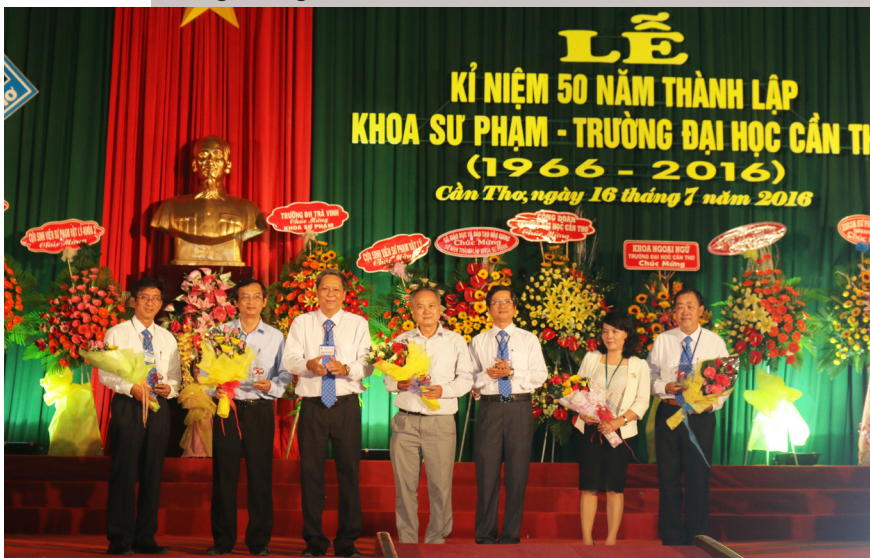
Những bông hoa tươi thắm như những lời cảm ơn trân trọng đến quý thầy cô - những người đã góp phần to lớn cho sự phát triển của Khoa Sư phạm trong thời gian qua.

Lễ kỷ niệm 50 năm ngày thành lập Khoa Sư phạm, Trường ĐHTC đã diễn ra thành công tốt đẹp. Đây có thể coi là mốc son đánh dấu sự trưởng thành và phát triển của Khoa Sư phạm nói riêng và Trường ĐHTC nói chung. Những thành quả đạt được của các thế hệ thầy cô giáo và sinh viên trong nửa thế kỷ qua là điều kiện thuận lợi để tập thể Khoa Sư phạm tiếp tục nỗ lực phấn đấu, góp phần phát triển hơn nữa trong thời gian tới.