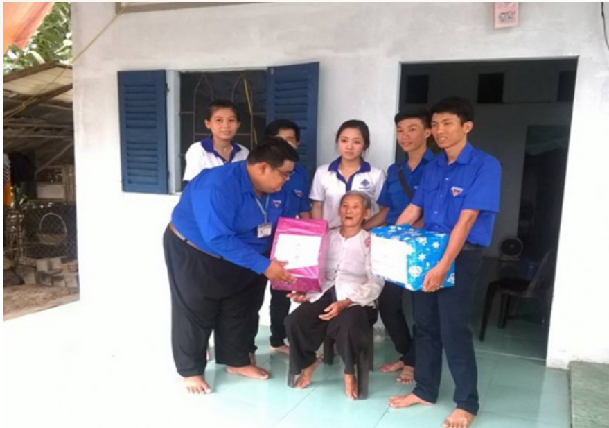
Hoạt động thăm và tặng quà cho gia đình chính sách.

Tham gia cùng các đoàn viên, thanh niên khác trong Khoa, tôi được đến xã Mỹ Khánh, huyện Phong Điền, thành phố Cần Thơ để giúp địa phương tôn tạo cảnh quan, giữ vững các tiêu chí xã nông thôn mới, đồng thời khai thông lối đi đường đất để hoạt động của người dân diễn ra thuận tiện. Tuy chỉ có một tuần ngắn ngủi gắn bó với người dân Mỹ Khánh