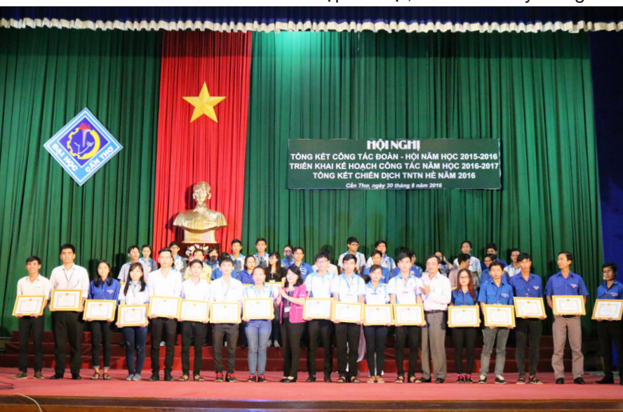
Khen thưởng cho 20 cá nhân vì đã hoàn thành xuất sắc nhiệm vụ trong Chiến dịch Thanh niên tình nguyện hè năm 2016 của Trường ĐHCT.

nâng cao chất lượng đào tạo, tăng cường giao lưu, trao đổi sinh viên quốc tế,... Phó Hiệu trưởng tin tưởng rằng với sự quan tâm, chỉ đạo sâu sát của Ban Thường vụ Thành đoàn, Ban Thư ký Hội Sinh viên thành phố, Đảng ủy-Ban Giám hiệu, sự đồng tình, ủng hộ của lãnh đạo các đơn vị trong trường cùng với tinh thần, nhiệt huyết của tuổi trẻ, sinh viên Trường ĐHCT sẽ tiếp tục phát huy, nỗ lực không ngừng đạt được nhiều thành tích hơn nữa để các em tự khẳng định mình và tự hào là sinh viên Trường ĐHCT.