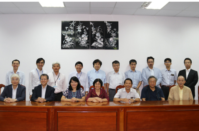
Ảnh lưu niệm tại buổi làm việc.

D ự án Hỗ trợ Kỹ thuật nhằm “tăng cường năng lực để Trường Đại học Cần Thơ (ĐHCT) trở thành trường xuất sắc về đào tạo, nghiên cứu khoa học và chuyển giao công nghệ” sử dụng viện trợ không hoàn lại của Chính phủ Nhật Bản, được triển khai thực hiện từ tháng 3/2016. Dự án gồm 03 hợp phần: (1) tăng cường năng lực nghiên cứu khoa học, (2) tăng cường năng lực đào tạo và (3) tăng cường hệ thống hỗ trợ kỹ thuật và hành chính.