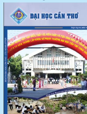
Ảnh bìa 1: Lễ kỷ niệm 50 năm thành lập Khoa Sư phạm

tại Công ty CP In Tổng hợp Cần Thơ tháng 9/2016.