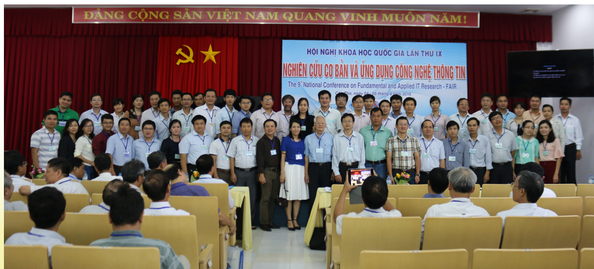
Đại biểu chụp ảnh lưu niệm.

Qua các kỳ tổ chức, Hội nghị FAIR đã mở rộng cơ hội để các nhà khoa học trong lĩnh vực CNTT giao lưu, học hỏi kinh nghiệm, chia sẻ các kết quả nghiên cứu mới nhất để triển khai, ứng dụng trong thực tiễn, từ đó, Hội nghị ngày càng khẳng định vai trò, tầm ảnh hưởng trong việc thúc đẩy nghiên cứu cơ bản, nghiên cứu ứng dụng về CNTT và Truyền thông tại Việt Nam.