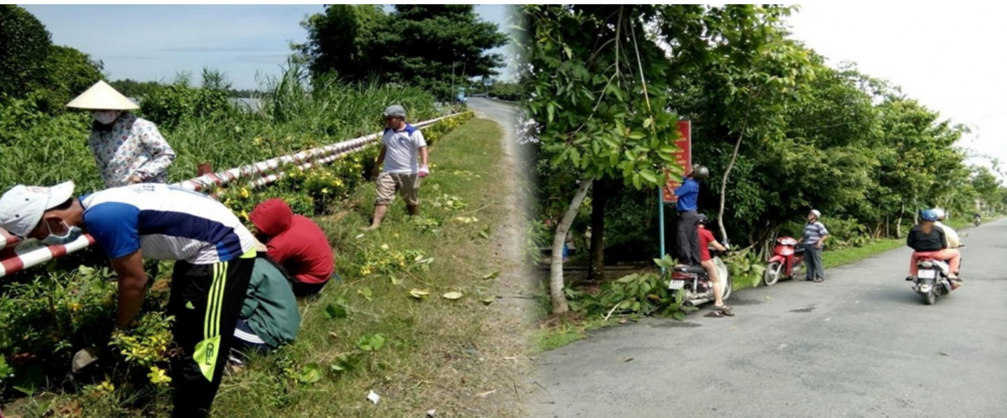
Dọn cỏ, chỉnh trang lại các cây hoa.

chứa đựng vô vàn bài học quý báu, mà đôi khi giảng đường không thể truyền đạt được.