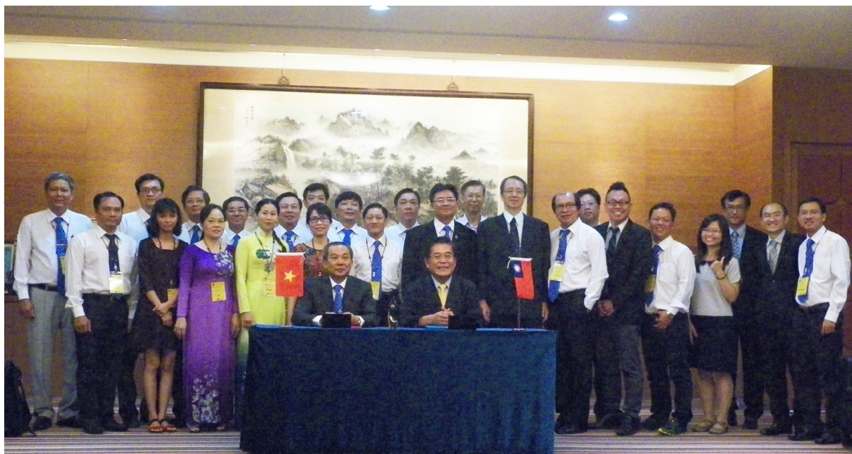
Đoàn công tác Trường ĐHCT thăm Trường Đại học Quốc lập Bình Đông.