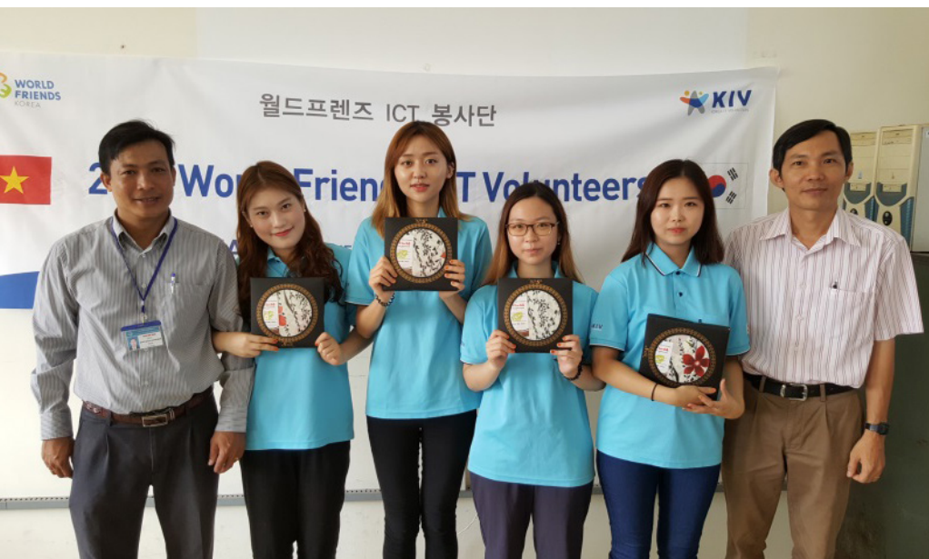
Lãnh đạo Bộ môn Điện tử Viễn thông chụp hình lưu niệm cùng nhóm tình nguyện viên.

Ngày 08/07 vừa qua, Bộ môn Điện tử Viễn thông, Khoa Công nghệ, Trường Đại học Cần Thơ đã đón tiếp đoàn sinh viên tình nguyện của chương trình Tình nguyện viên Công nghệ thông tin (Korean IT Volunteers - KIV), Hàn Quốc. Trong lần ghé thăm này, đoàn sinh viên Hàn Quốc đã tham gia giao lưu văn hóa và mở lớp lập trình Java trong hai tuần.